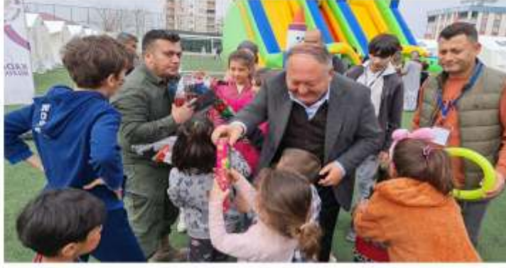
oyuncak dağıtıp oyun gruplarında eğlenmelerini sağladı.BLD.BSN.YAY.

Kadirli Belediyesi, Gençlik ve Spor Müdürlüğü olarak ilçemizde kurulan çadır kentteki çocukların depremin olumsuz etkilerinden kurtulması için çeşitli etkinlikler ve oyunlar düzenleyerek eğlenceli vakit geçirmelerini sağladık. Ayrıca ailelere Psikoloğumuz tarafından Psiko-sosyal destek verilirken